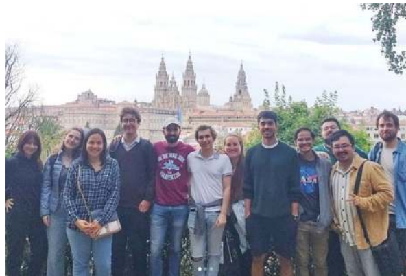
Act. con Inscripción Previa