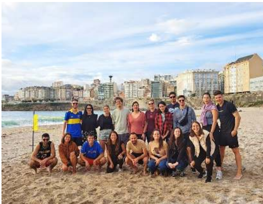
Act. de Asistencia Espontánea

Son organizadas por las personas voluntarias que integran nuestra asociación en diversas localidades de Galicia.