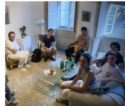
Talleres de Asistencia Libre