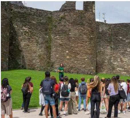
Paseos y Excursiones

Participantes en nuestras propuestas durante el 2023.